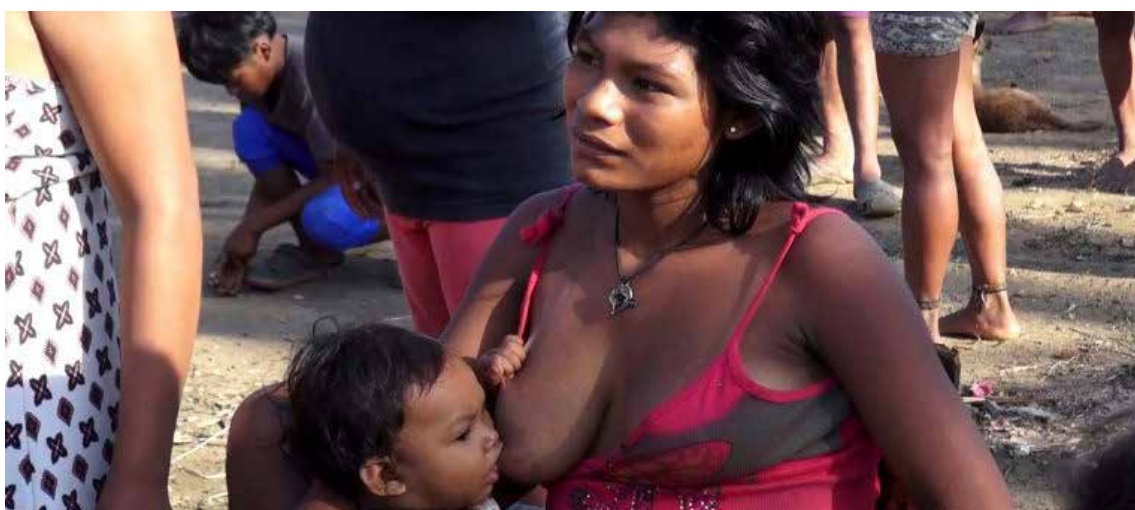
Una comunidad que aguanta hambre y totalmente abandonada por un Estado canibal.

En Colombia, año 2012, la media de sacados de su lugar de origen alcanzó los 4.444.444, casi el 10% de la población, lo anterior, pese a la sentencia T-025 del 2004 de la Corte Constitucional, que obliga a los gobiernos a tomar medidas de manera coordinada, tendientes a superar las fallas estructurales que entorpecen una atención pronta y oportuna, verbigracia, la situación de caos por la que atraviesan los indígenas Nukak, que se encuentran en vía de extinción física y cul-