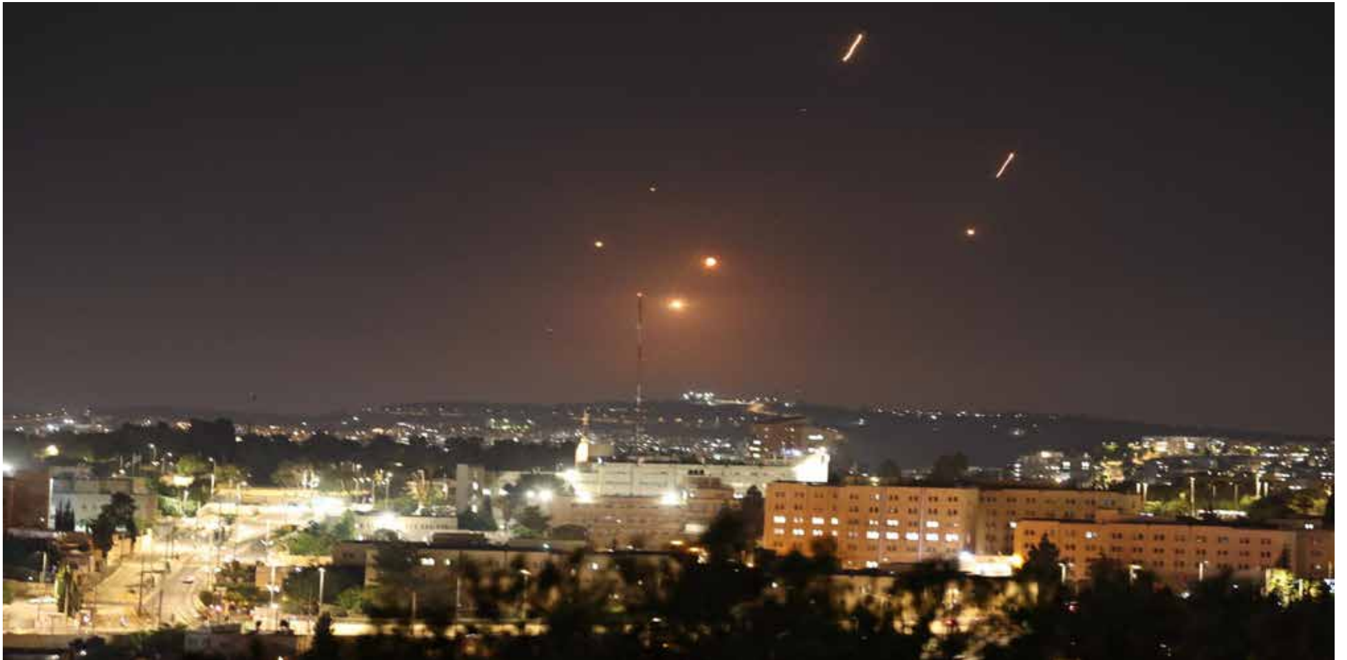
Misiles iraníes cruzan el cielo de Jerusalén, como respuesta a los bombardeos de Tel Aviv contra instalaciones nucleares iraníes.