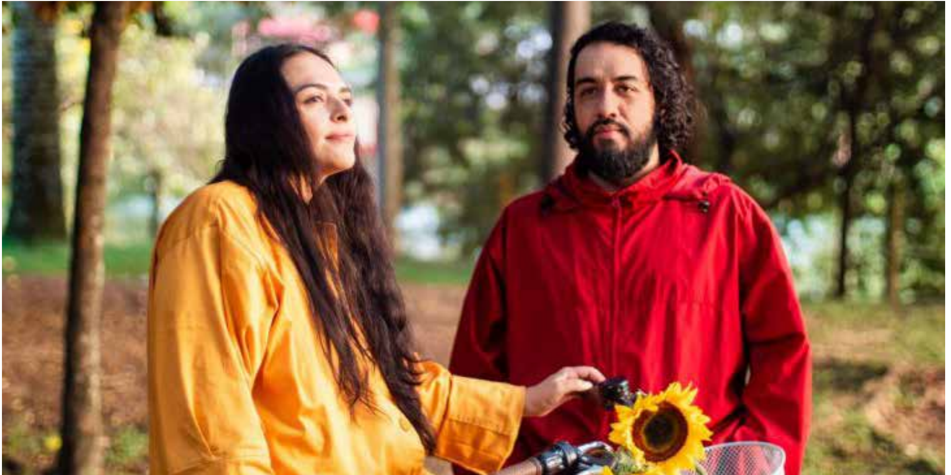
'Nostalgia', la aclamada agrupación colombiana de rock alternativo Clandestino

La banda colombiana de rock alternativo regresa con una poderosa canción que explora el peso del pasado y el anhelo de sanación, inspirada en el indie rock y el britpop noventero.