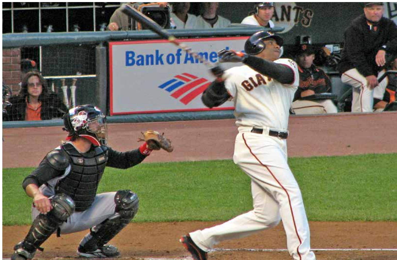
Batear de jonrón