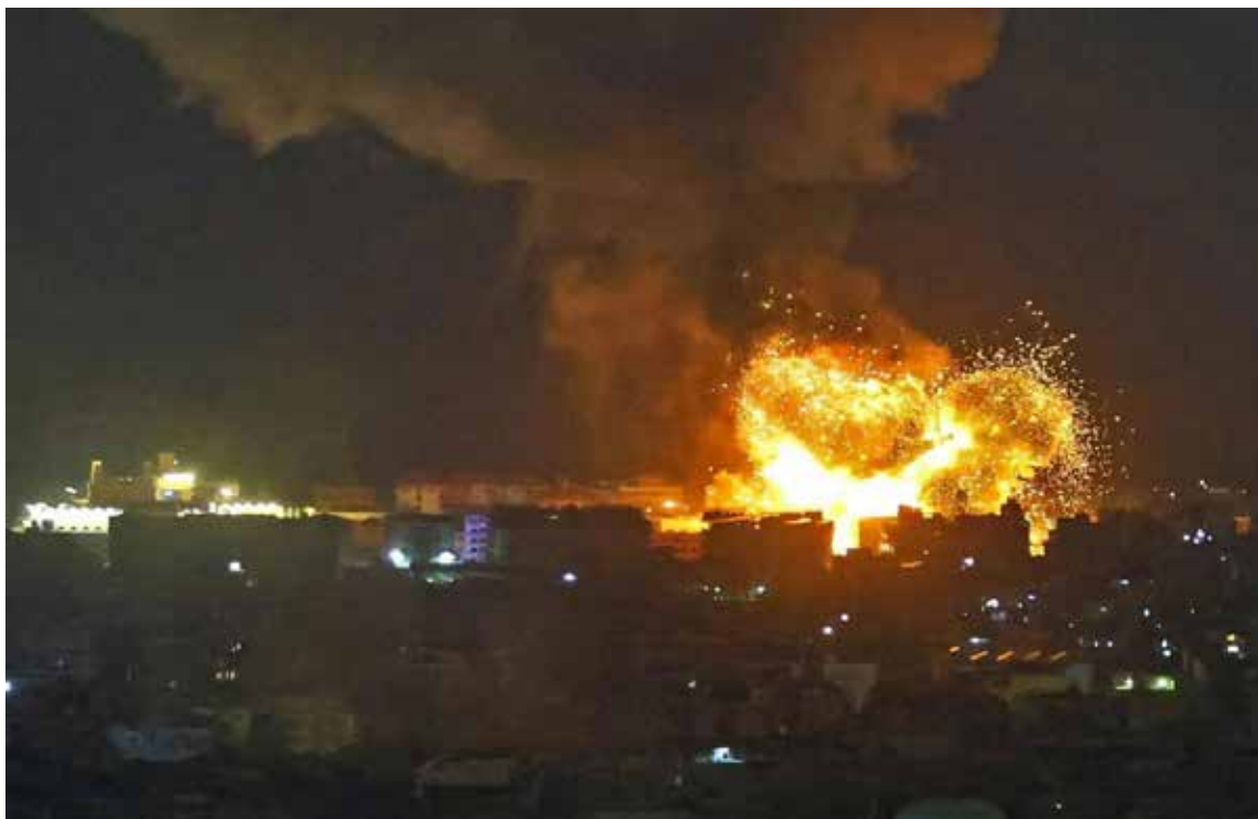
Guerra entre Israel, Irán y Líbano, del conflicto en Oriente

menos 380 misiles balísticos lanzados, la mayoría de los cuales fueron interceptados por el sistema de defensa israelí Cúpula de Hierro. Sin embargo, algunos proyectiles lograron impactar objetivos militares y civiles, incluyendo un autobús vacío en el área metropolitana de Tel Aviv. Irán ha afirmado haber desplegado misiles hipersónicos Fattah-1 y haber logrado un «control completo sobre los cielos de los territorios ocupados».