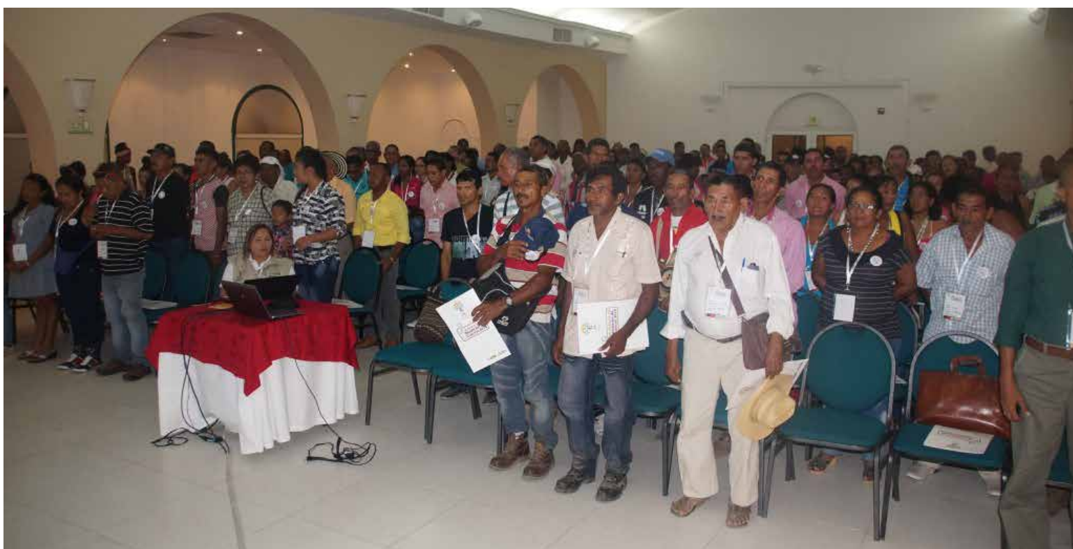
Las víctimas de Mancuso esperan se les devuelvan sus tierras.

Las cerca de mil hectáreas despojadas corresponden a las haciendas Tierra Santa, que se constituyó producto del englobe de los predios; La Trinchera, La Unión,