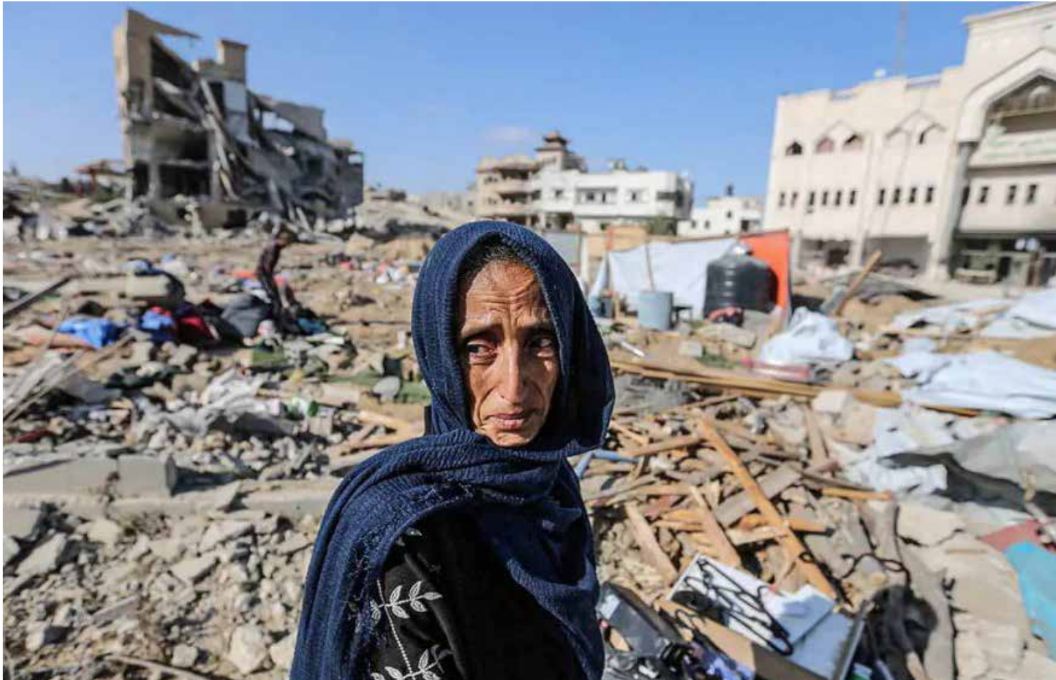
Israel, Irán y el alto precio económico y humano de la guerra

menos 380 misiles balísticos lanzados, la mayoría de los cuales fueron interceptados por el sistema de defensa israelí Cúpula de Hierro. Sin embargo, algunos proyectiles lograron impactar objetivos militares y civiles, incluyendo un autobús vacío en el área metropolitana de Tel Aviv. Irán ha afirmado haber desplegado misiles hipersónicos Fattah-1 y haber logrado un «control completo sobre los cielos de los territorios ocupados».