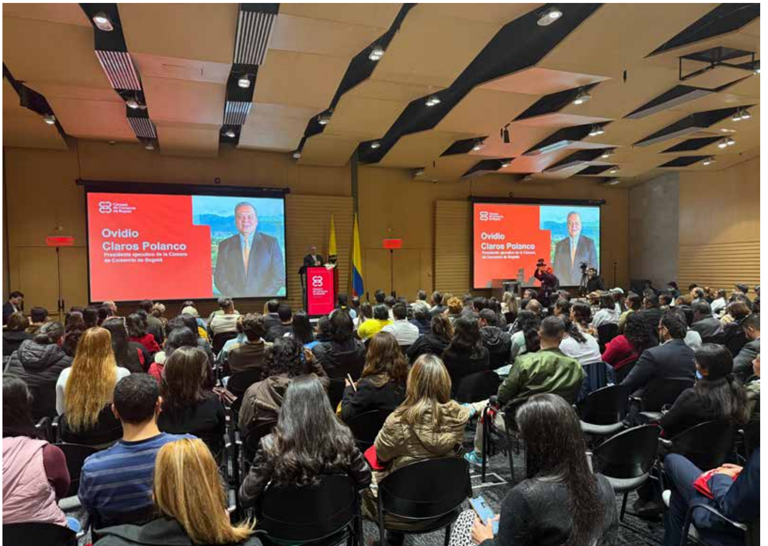
300 postulaciones, 200 negocios fueron elegidos para esta edición de Gastrofest, con un enfoque central en el producto local y el fortalecimiento empresarial.

Gastrofest se consolida como una plataforma única para que estos establecimientos ganen visibilidad, refuercen su propuesta de valor y conecten con miles de comensales. Esta edición promete novedades y más oportunidades para que