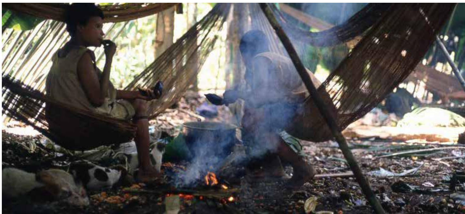
Pareja nukak en un campamento