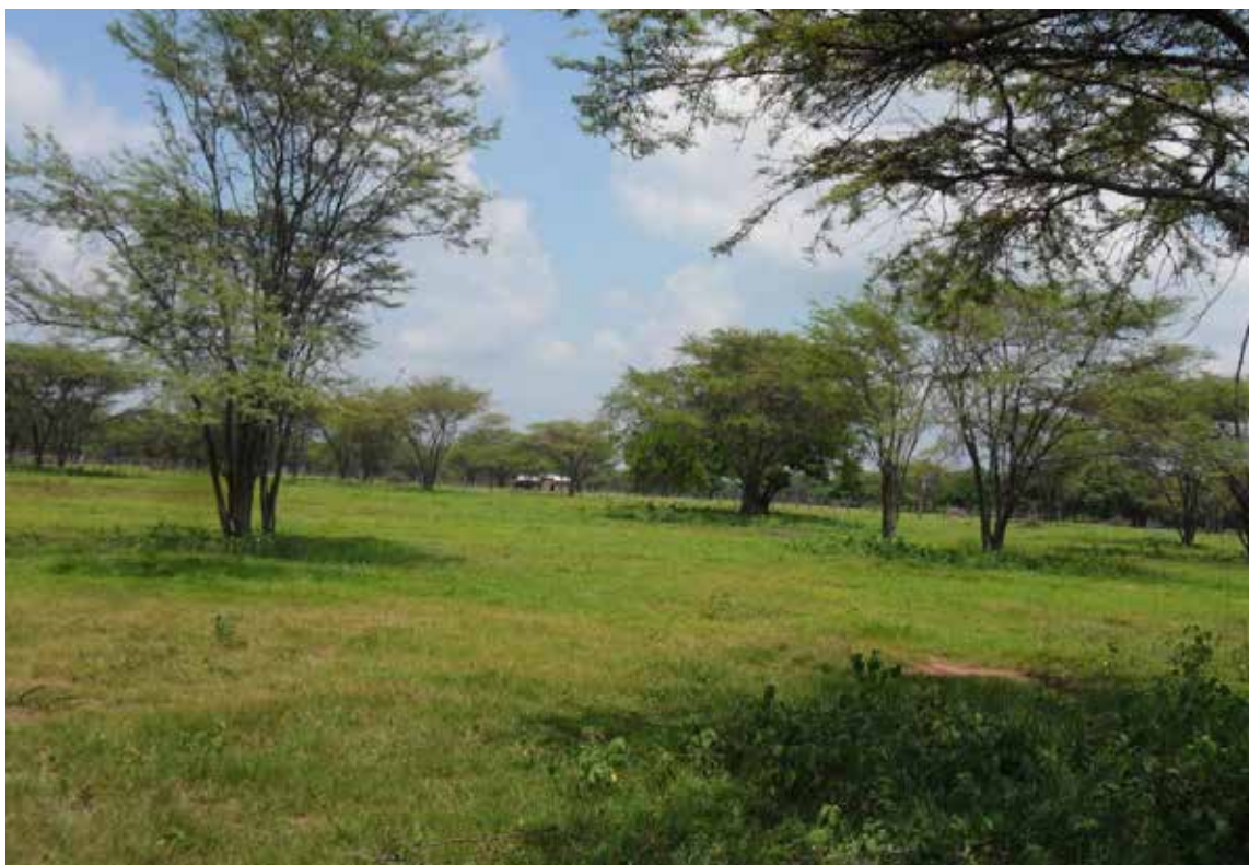
Tierras despojadas por Mancuso volverán a manos de campesinos cordobeses