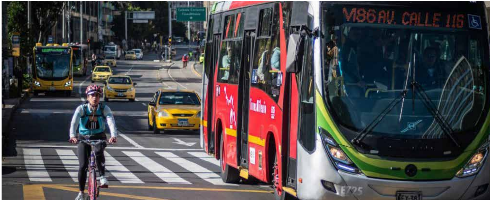
En Colombia, según el Ministerio de Ambiente y Desarrollo Sostenible, la calidad del aire se ve afectada principalmente por el material particulado PM10 y PM2.5, emisiones generadas en su mayoría por el transporte urbano y la maquinaria fuera de carretera.

Dos hitos en el país son notablemente destacables, el primero de ellos es el apoyo técnico a la expedición de la Resolución 0762 de 2022, que estableció límites de emisión para maquinaria fuera de carretera, esta regulación permitirá un tránsito hacia tecnologías más limpias y sos-