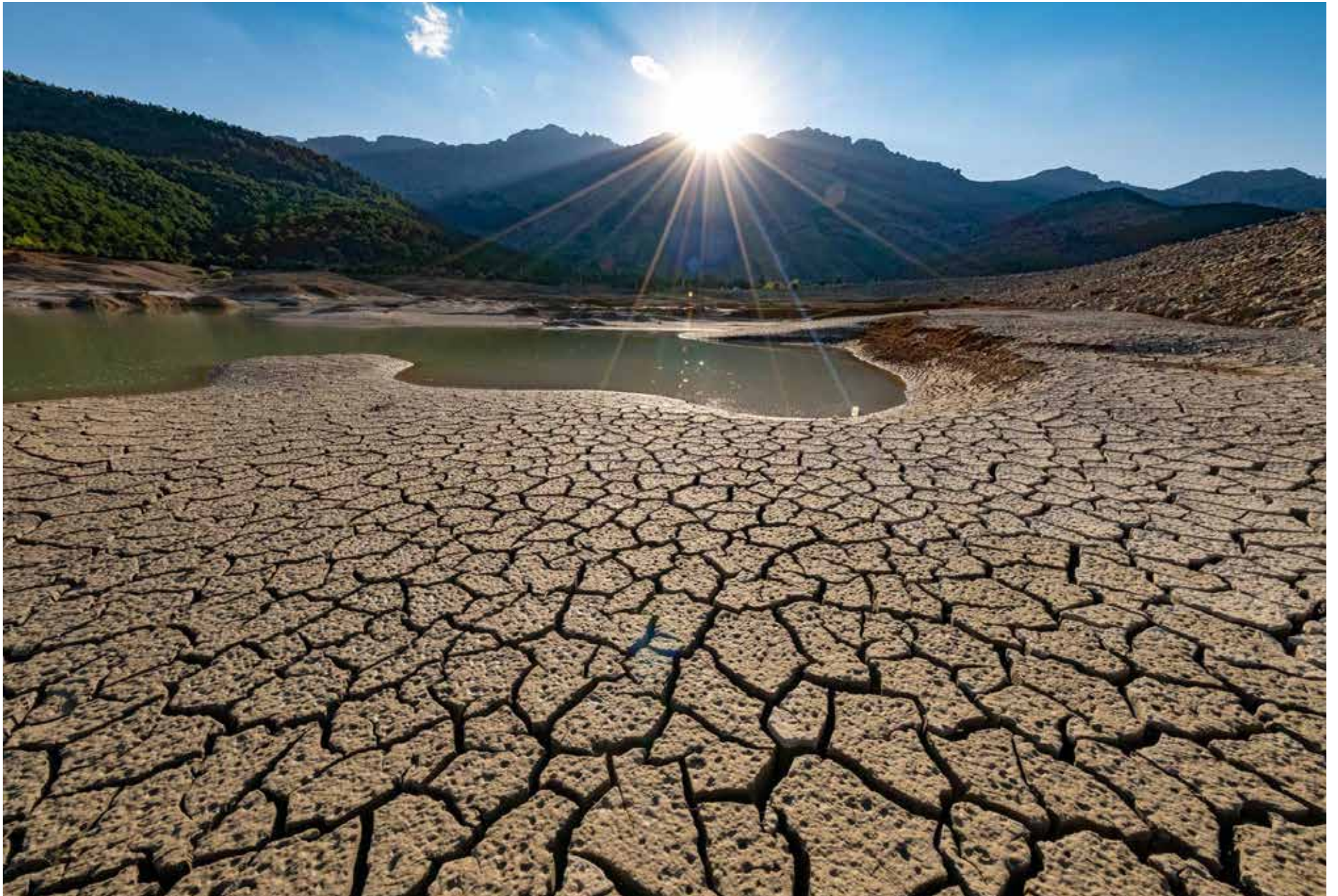
Día Mundial de la Lucha contra la Desertificación y la Sequía hablando sobre los problemas de agua y uso de suelos.